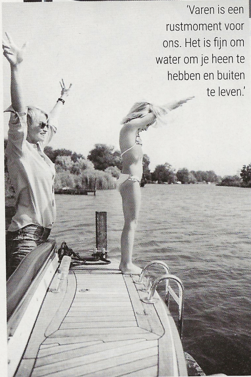
'Varen is een rustmoment voor ons. Het is fijn om water om je heen te hebben en buiten te leven.'

'Ik vind het leuk om in de keuken bezig te zijn, maar ik moet er wel tijd voor hebben. In het weekend probeer ik graag dingen uit, zoals taartjes bakken of gezonde sappen maken. Een handige truc voor de kinderen om ze dingen te laten lusten die ze normaal niet willen eten: "monstersap" met spinazie gaat er makkelijker in dan "spinaziesap".'