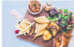
Ma' Plucker - 75 Beak Street, Londen (Soho) - www.maplucker.com

Kip speelt een grote rol zemen de Soul Food, en ondanks dat er in Londen op gamma pieken kip te krijgen is, zegt Ma' Plucker voor een verfresend en toegankelijk concept. In de kleine, met retro-behaling versende zaak in Soho kan je kiezen voor drie verschillende kipsoorten: geroosterd (een kwart, halve of hele kip), grillvraagd in karnemelksoep (vraagde, dij of borststuk) of 'saald chicken' (125 of 250 gram). Jouw chicken of choice kan op een broodge, een maple waffle, of vepgeald van stukjes groen (baas, sig), de topt je kipgerecht af met één van de vijf sauzen (de leuke chll glaze is een aanrader) en je hebt de beste kafen-maaltijd vraagd! Ook zonder de naswelen van een avond doorsloven is het goed toeven met Ma' Plucker's Afternoon Tea, bestaande uit liffete met een 'k', een selectie rinstburgers en zoete lekkernijen.