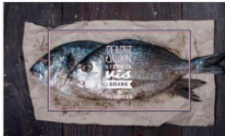
Sea Salt Saloon, Weid 3, Utrecht - www.seasaltsaloon.nl

Stiek in vis, drink en verhalen, lukt de pay-off. Nou, daar heb je ons al. Zodra iets steer verspreid is, staan onze oren gespikt. Ze hebben hier oeviche, kreeft, hele dorade's en zo preterden dat 'van visvies' bestaaf uit maar lukt is scoorten vis en 14 verse schaal- en scheldpieren? En dat er in één gamelerweek 127 Hollandse gamalen ziften? De heren van de Sea Salt Saloon zeggen dan wel dat zo het leven met een korrel 'zo nemen', maar die vis die dagelijks bij ochtendgieren door zijn van An. As bij de visafslag wordt geselecteerd en op het Utrechtse Weid wordt afgeleverd, dat's een slaadbarreus zaak. Paar genisten van het soete van vis, schaal en schels. Zonder poezies. Dat nemen wij zeker niet met een korrel zout.