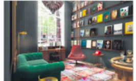
Pultizer Amsterdam - Keizersgracht 224, Amsterdam - www.pultizeramsterdam.com

Het Pultizer in Amsterdam heeft een metamorfose ondergaan. Daar is pas eind dit jaar volledig voltoafd, maar tot onze veeugde zijn het restaurant Jansz, en de suites van het hotel al in een nieuw jasje gestoken. Voor de herinrichting heeft het Pultizer het jonge talent Jansz Simons aangeworven. De creative director weerde eerder als senior designer voor Tom Dixon (ja die van die toffe koperen lampen). Alvorens de reding van de suites orden zijn herde te nemen, heeft hij in elke suite gestoken om er de juiste sfeer aan te geven. Het resultaat mag er zijn: een samenstelling van authentic en vresend. Wij kunnen niet veken tussen de 5 prachtige suites geroosterd op kunst, antik, illustrat, muziek en Pultizer zelf, met in de badkamers heel unieke de luxe toilettes van Le Labo. Er zit maar één ding op: snel een kijke nemen (of een slaage doen).