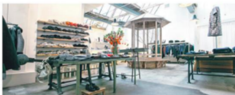
XBank - Spuistraat 172, Amsterdam