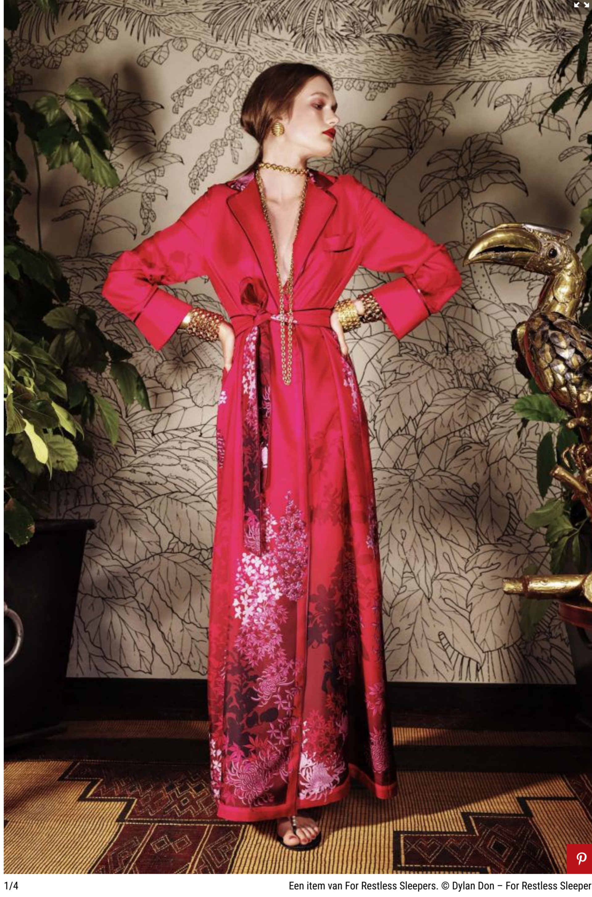
1/4 Een item van For Restless Sleepers. © Dylan Don - For Restless Sleepers

Voordat we spraken over een pyjama, droeg men een nachthemd. Dat was vooral gebruikelijk voor mannen in de Victoriaanse tijd. Interessant is dan wel weer het materiaalgebruik: katoen, linnen, zijde of flanel. Pyjama's worden nog steeds van dergelijke stoffen gemaakt. Echter, toen de vrouwen zich aan de pyjama waagden en er een broek aan was toegevoegd, werden ook de uitvoeringen luxer. In de jaren 30 was het niet vreemd als vrouwen (tevens als uiting van emancipatie) een pyjama droegen als ontvangsttenue. In de chiquere Franse kringen was dat de nieuwe trend. Zo luidt deze observatie uit de krant 'Le Soir' uit 1930: "De pyjama wordt steeds populairder onder de dames. In Parijs is het gebruikelijk om van vijf tot zeven of van zes tot acht te ontvangen in een pyjama van mousseline of lamé, dit is heel elegant, nauwelijks mannelijk, met een wijde broek die veel op een rok lijkt...maar, uiteindelijk nog steeds een broek is. Dit is zeer gracieus."